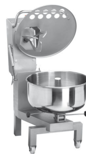
Position chargement Loading position

PMX60 Bowl driven by the product PMX60 CM Motorized bowl – 2 motors Entirely in stainless steel 18-10 Arm can be raised Removable arm (available on request) Tipping bowl With the wheels Entirely waterproof – Easy cleaning Oil bath reducer (permanently oiled) Lid of protection in stainless steel Complies with CE norms