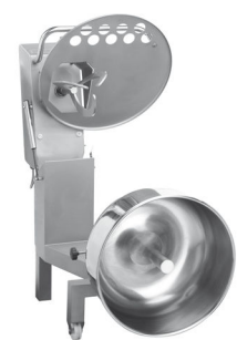
Position nettoyage Cleaning position