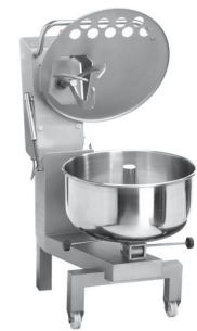
Position chargement Loading position