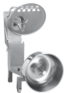
Position nettoyage Cleaning position