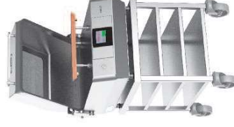
• Chariot pour Astor 416-421 Table with castors